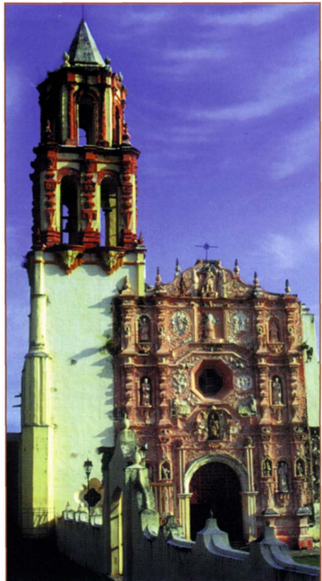
Misión de Landa.

Cantidad total de habitantes: 19,493, que representan el 1.4% de la población estatal,