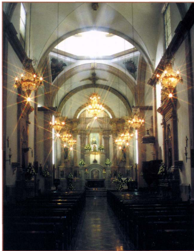
Templo de Nra. Señora del Pueblito.

Número de localidades: 116: Localidades menores a 999 habitantes, 106. Localidades de 1000 a 1999 habitantes, 4. Localidades de 2000 a 2499. 1. Localidades de 2500 a 9999, 4. Localidades de 20,000 a 49,999, 1.