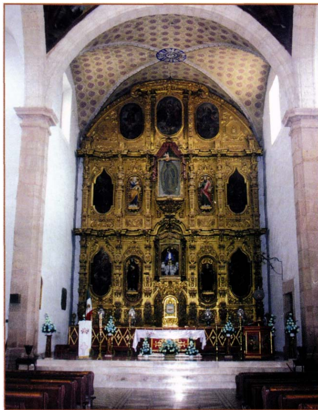
Retablo de la Parroquia de San Pablo y San Pedro.

Numero de localidades? 235. Numero de localidades menores a 999 hab., 226: de 1000 a 1999, 7: y de 2000 a 2499 hab. 1.