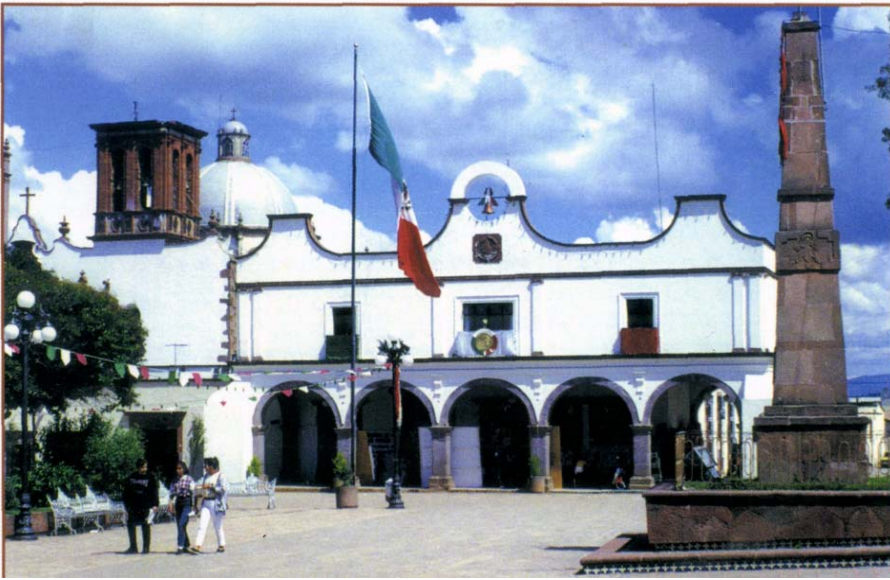
ti it 'S/em/i/c-